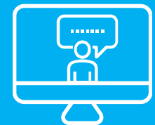
FOLLOW UP WEBINAR